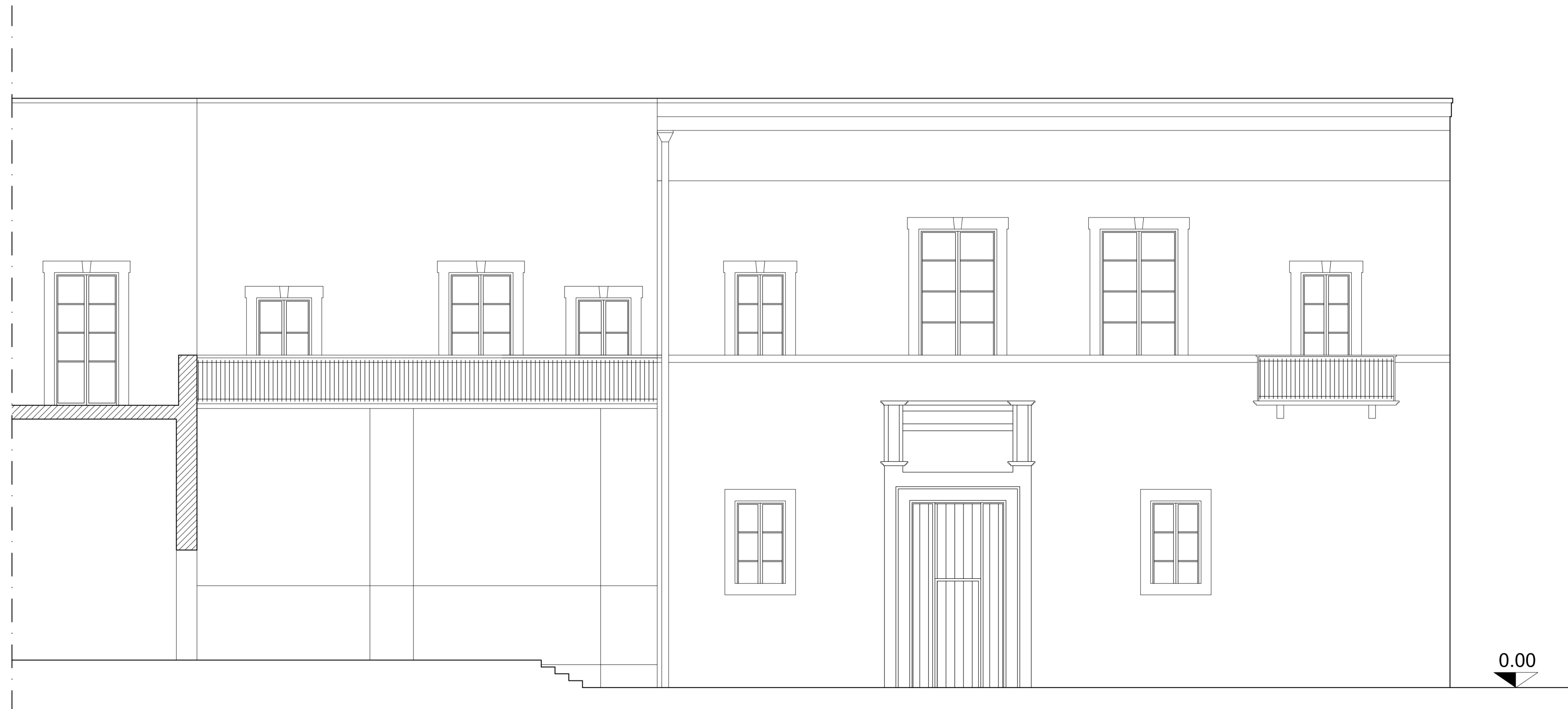
PROSPETTO SU PIAZZA S.AGOSTINO